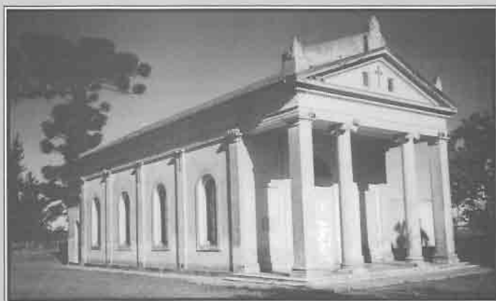
Nuevo Templo inaugurado en 1872, con cementerio, ambos aún existentes.