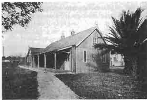
Iglesia de Talleres

Inauguración y Consagración de la nueva Iglesia en Talleres, hoy conocida como Remedios de Escalada: La nueva Iglesia en Talleres fue consagrada el domingo 3 de agosto de 1913. Más detalles sobre este importante evento se mencionarán en el capítulo 65.