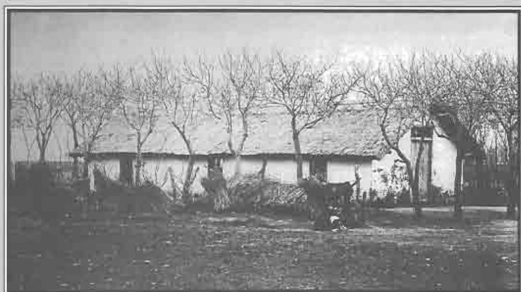
Iglesia Rancho (Rancho Kirk) 1857-1872

Iglesia Presbiteriana San Andrés, Chascomús